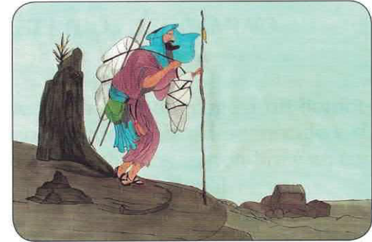
Bajaba un hombre de Jerusalén a Jericó.