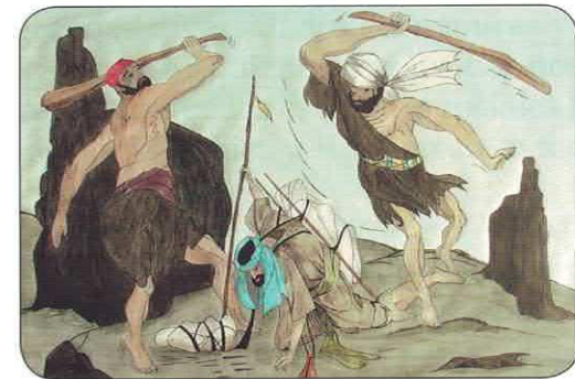
Y cayó en manos de unos ladrones que lo dejaron medio muerto.